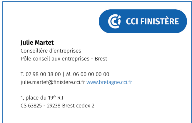
Exemple 2 : poste non mutualisé