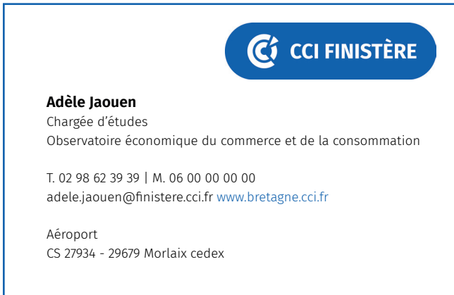
Exemple 1 : poste mutualisé